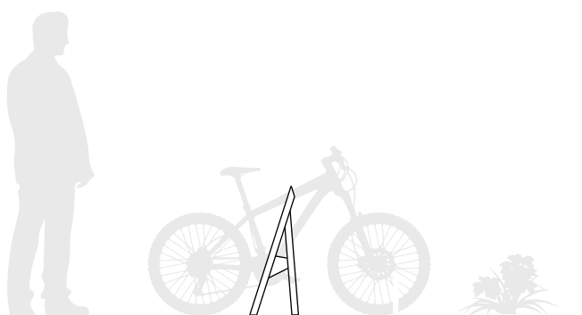
Ubicación de la bicicleta